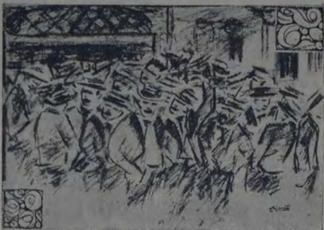
Frente a la Casa del Pueblo, con emoción y optimismo, numerosos ciudadanos siguen las alternativas del escrutinio.