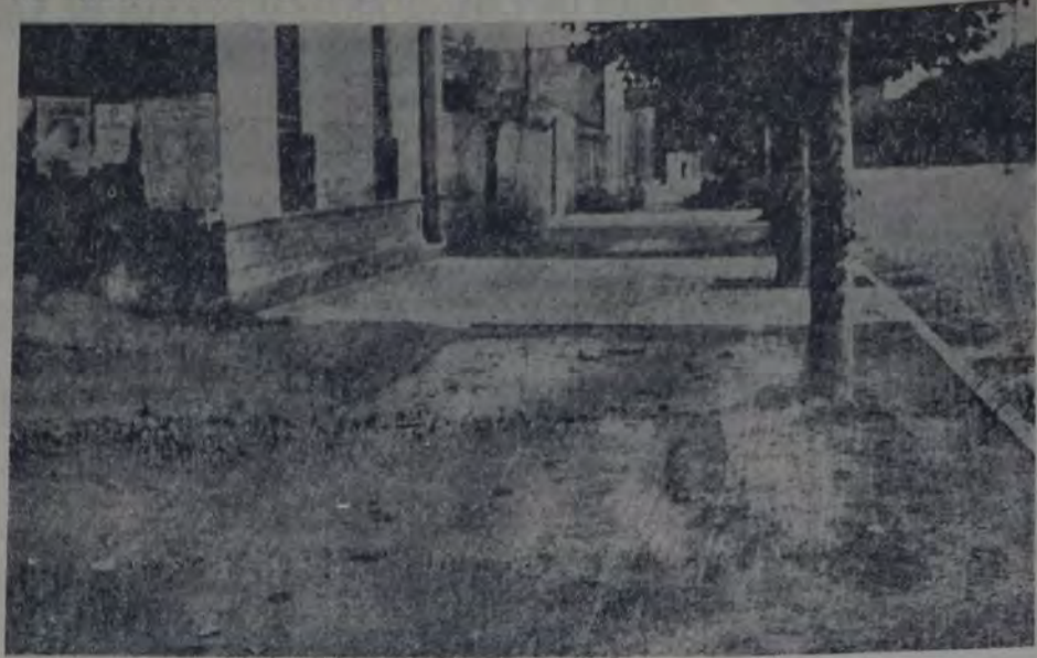
En la calle 1 entre 9 y 60 puede observarse este lamentable estado de las veredas, que se ven convertidas los días de lluvia en verdaderos lodazales que impiden el tránsito por esta importante cuadra, situada en un barrio sumamente populoso.